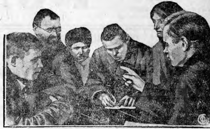
Ударники колхоза „Победа“ обсуждают составленный производственный план и вносят свои поправки. План вынесен на общее собрание колхозников.

Секретарь центрального комитета ВКП(б) И. Сталин